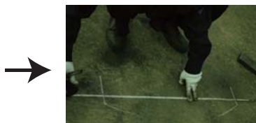
アイ作成部分の寸法は少々複雑の為、正確に慎重に!!