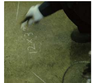
製作するロック加工品の長さ・ロープ径もマーキング。安全の為に、確認は念入りに行います。