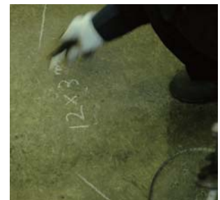
製作するロック加工品の長さ・ロープ径もマーキング。安全の為に、確認は念入りに行います。