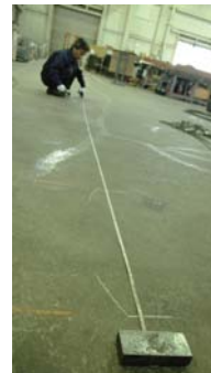
ずれない様にスケールに重石を置いてマーキング。