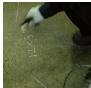
製作するロック加工品の長さ・ロープ径もマーキング。安全の為に、確認は念入りに行います。