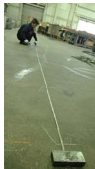
ずれないようにスケールに重石を置いてマーキング。