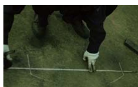
アイ作成部分の寸法は少々複雑の為、正確に慎重に!!