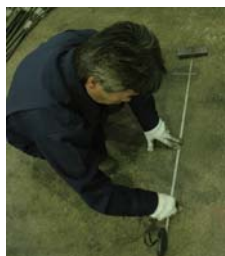
算出した必要寸法をマーキングしていきます。